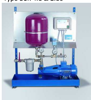
Type DSK 4.1 & 2.16