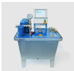
Type HSPE & HSPD

Livré avec bac de rétention fuel et sonde de détection de fuites.